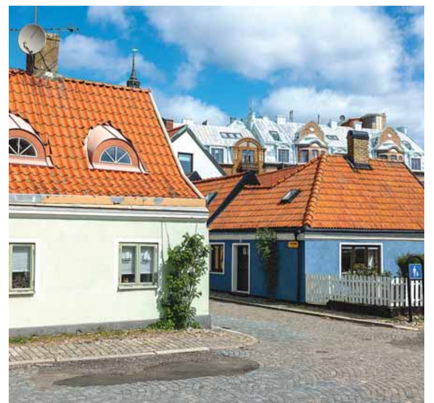
L'architecture suédoise traditionnelle dans la ville d'Ystad. VINCENT MIVELAZ

Par ailleurs, elle dispose d'un accès privilégié à la mer Baltique, son panorama côtier à respirer à pleins poumons et ses plages accueillantes. Les loisirs variés y sont légion, entre randonnées le long des falaises rocheuses et parties de plaisir aquatiques.