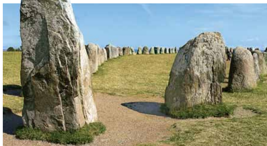
Ale Stenar, aussi appelé le «Swedish Stonehenge», un complexe funéraire de 59 pierres.