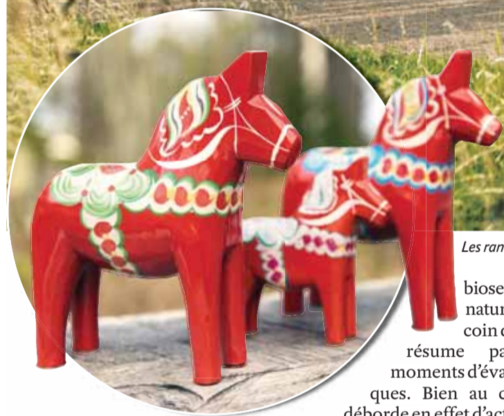
Les randonnées à vélo ou pédestres sont légion autour de Ystad. PATRICK LOHRI

Evoquer ce pays résonne comme une invitation à l'évasion majuscule, à la découverte d'un écrin de nature préservée, où le temps semble comme suspendu. En toute saison.