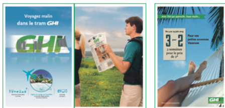
A B C

6 pages – collage droite ou gauche Format superpano (B = 3 pages): 895 x 440 mm Format page simple (A et D): 290 x 440 mm Délai: 3 semaines avant parution Tarif: prix sur demande base papier standard, contrat volume valable, possibilité papier amélioré