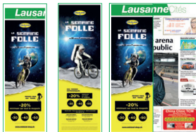
Recto Verso Une

1/2 page de couverture Format recto: 142x396mm / Format verso: 142x440mm Délai: 3 semaines avant parution - Tarifs sur demande