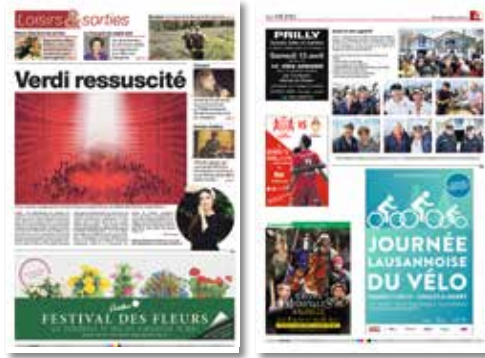
Ouverture Loisirs & Sorties