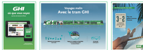
A B D

8 pages en portefeuille – collées des deux côtés Format superpano (C = 4 pages): 1185 x 440 mm Format pano (B = 2 pages): 605 x 440 mm Format page simple (A et D): 290 x 440 mm Délai: 3 semaines avant parution Tarif: prix sur demande base papier standard, contrat volume valable, possibilité papier amélioré