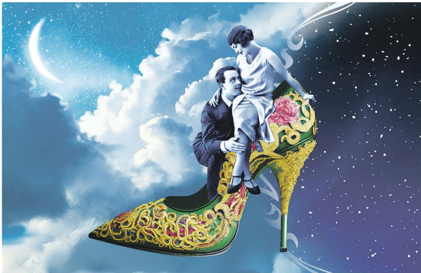
La Cendrillon de Jules Massenet s'apparente à un conte de fées pour grands enfants. OK

OPÉRA - Tout le monde connaît Cendrillon, le célèbre conte de fées de Charles Perrault, n'est-ce pas ? Mais saviez-vous que c'est l'une des œuvres qui a le plus marqué les compositeurs au fil des années ? On passera sous silence l'extraordinaire ballet de Sergueï Prokofiev, de même que le superbe opéra-comique destiné au jeune public de Pauline Viardot représenté en novembre à l'Opéra de Lausanne. Des décennies pour aller jusqu'au chef d'œuvre proposé : le fabuleux «Cendrillon» de Jules Massenet créé en 1899 à