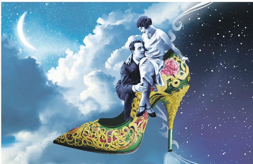
La Cendrillon de Jules Massenet s'apparente à un conte de fées pour grands enfants. OK

OPÉRA - Tout le monde connaît Cendrillon, le célèbre conte de fées de Charles Perrault, n'est-ce pas? Mais saviez-vous que c'est l'une des œuvres qui a le plus marqué les compositeurs au fil des années? On passera sous silence l'extraordinaire ballet de Sergueï Prokofiev, de même que le superbe opéra-comique destiné au jeune public de Pauline Viardot représenté en novembre à l'Opéra de Lausanne. Des décennies pour aller jusqu'au chef d'œuvre proposé: le fabuleux «Cendrillon» de Jules Massenet créé en 1899 à